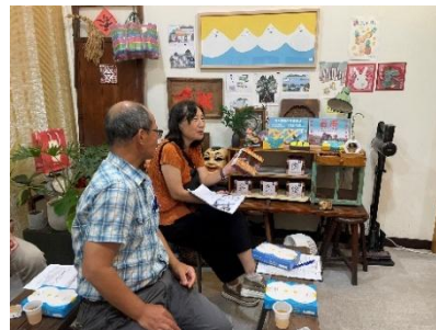
專家顧問諮詢訪視辦理情形